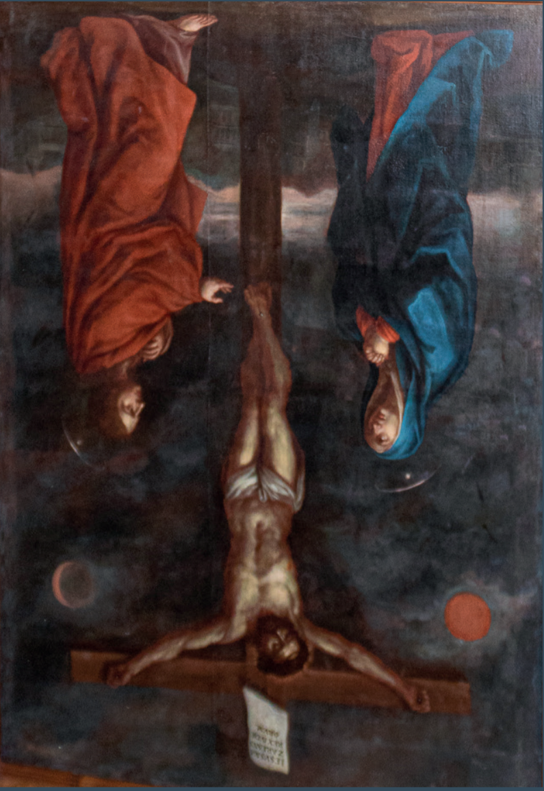
REAL IGLESIA PARROQUIAL DE SANTA MARTA MARTOS (JAÉN)